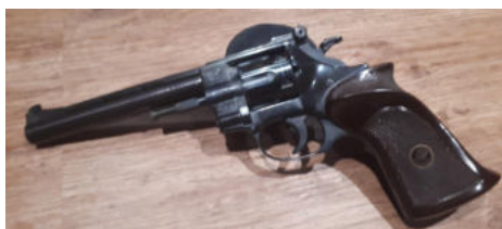
Arminius HW9, 6-schüssiger Trommelrevolver cal. 22lr