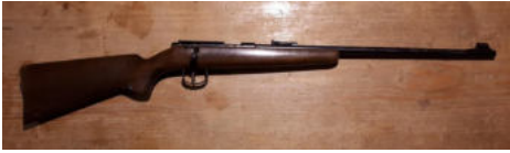
Büchse Anschütz cal. 22lr