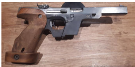
Walther GSP, halbautom. Pistole cal. 22lr

Vereinswaffen die an diesem Tag nicht versteigert werden, gehen im Anschluß in den öffentlichen Verkauf.