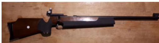
Büchse Weihrauch HW60M cal. 22lr