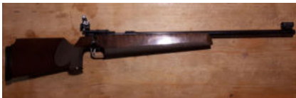
Büchse Anschütz Modell 54 cal. 22lr