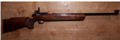
Büchse Walther cal. 22lr