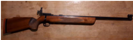
Büchse Walther cal. 22lr