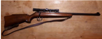
Büchse Anschütz cal. 22lr