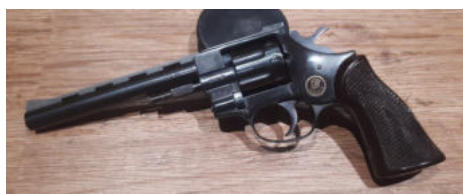
Arminius HW7, 8-schüssiger Trommelrevolver cal. 22lr